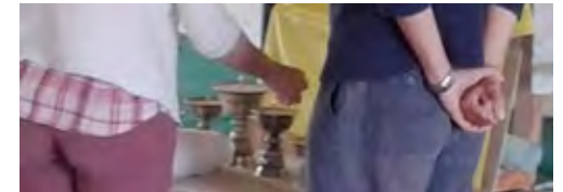
Elena Bisagni, la nièce de Tina, allume les lampes sur l'autel.