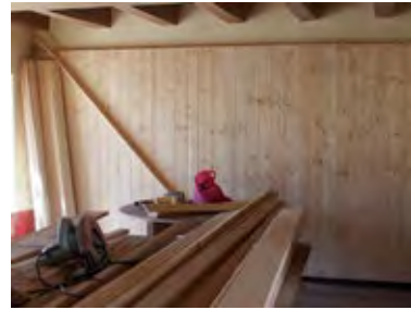
Lambris : 1 m de haut dans les salles réservées au staff et au MC et 2 m dans les salles dédiées au cours