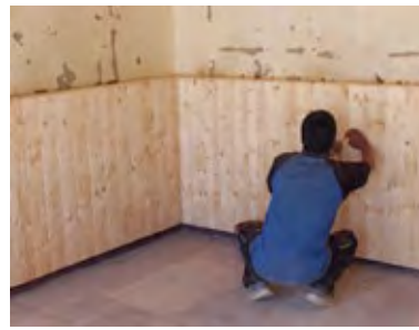
Pose du lambris