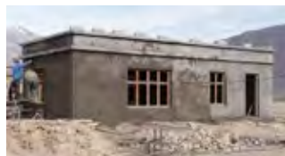
OBP : pose du ciment extérieur