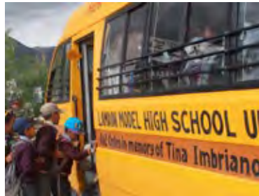
Le 2 ème bus a été dédié à la mémoire de Tina

La question du travail du chauffeur en plus de la conduite reste posée car dans la tête d'un chauffeur zanskarpa, il est normal de nettoyer la voiture, les bâtiments de l'école (vitres par exemple) pas du tout !!!