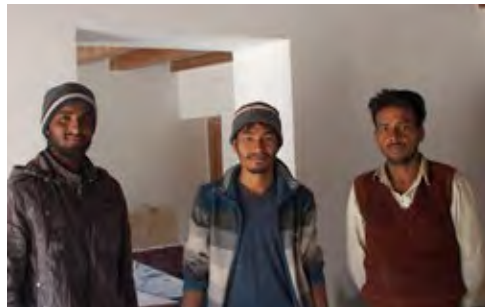
l'équipe de peintres indienne